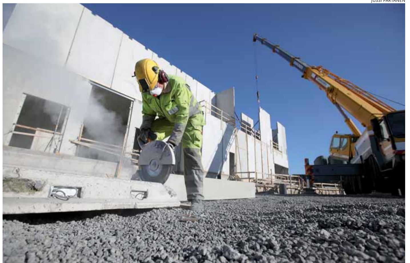
IV- ja nostinlaiterakennuksen elementtiasennukset olivat Olkiluodossa täydessä vauhdissa syyskuun puolivälissä. Myöhemmin syksyllä aloitetaan ONKALOn ilmanvaihdosta tulevaisuudessa huolehtivan rakennuksen LVIAS-työt.

ONKALOn henkilökuilu on tiivistetty valmiiksi maan pinnalta 437 metrin syvyyteen. Myös poistoilmakuilu on tiivistyksen osalta valmis. Suunnitelmien mukaan poistoilmakuilun nousuporaus aloitetaan alkuvuodesta 2011.