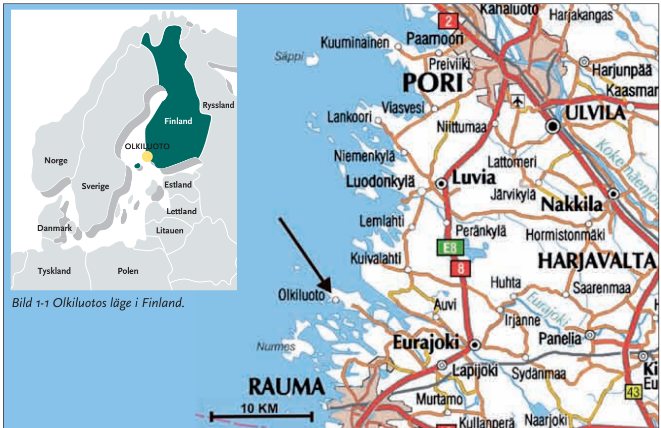
Bild 1-1 Olkiluotos läge i Finland.